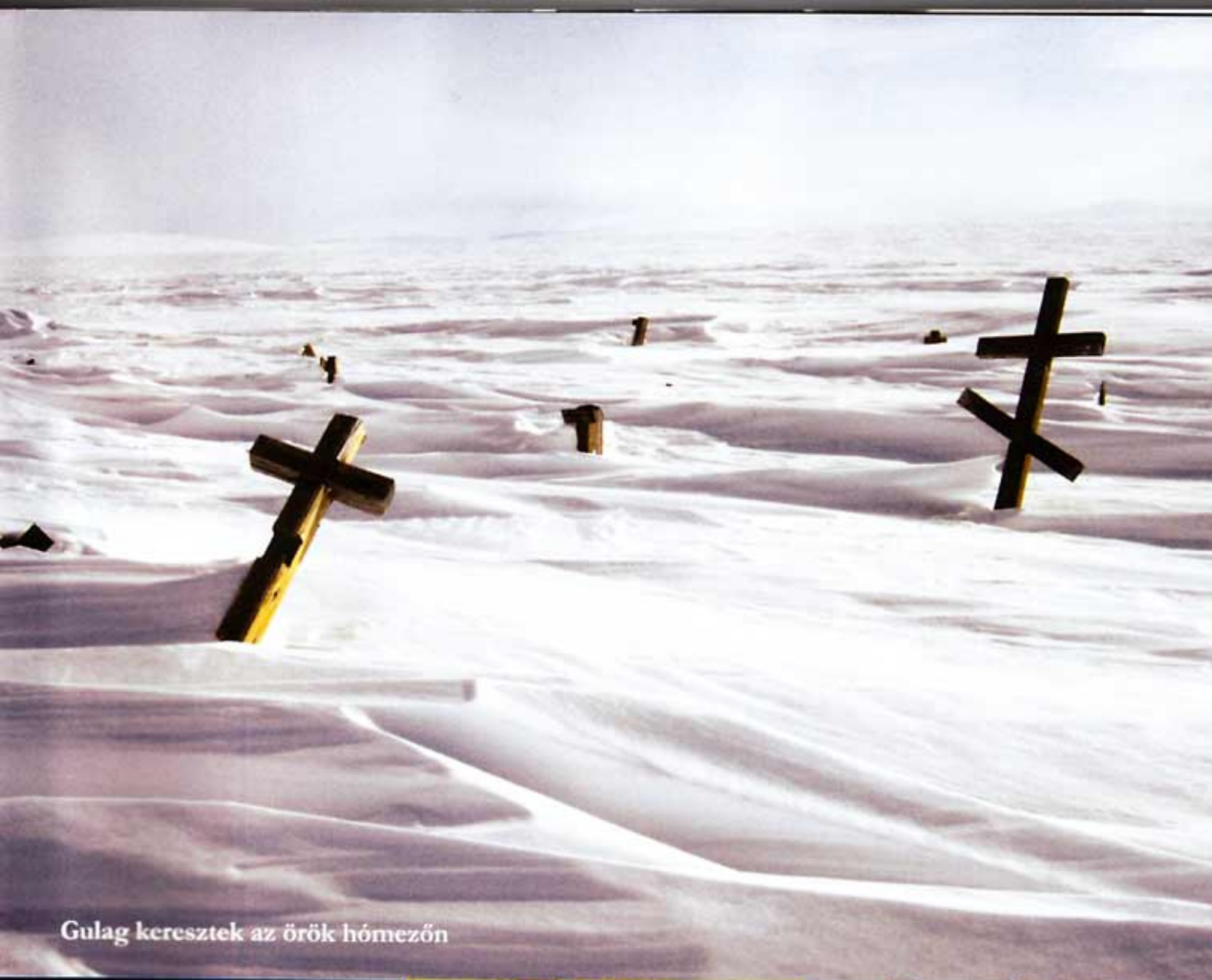
Gulag keresztjek az örök hómezőn

„-56 Celsius-fok volt, és elképzelhetetlennek bizonyult még a nappali alvás is”