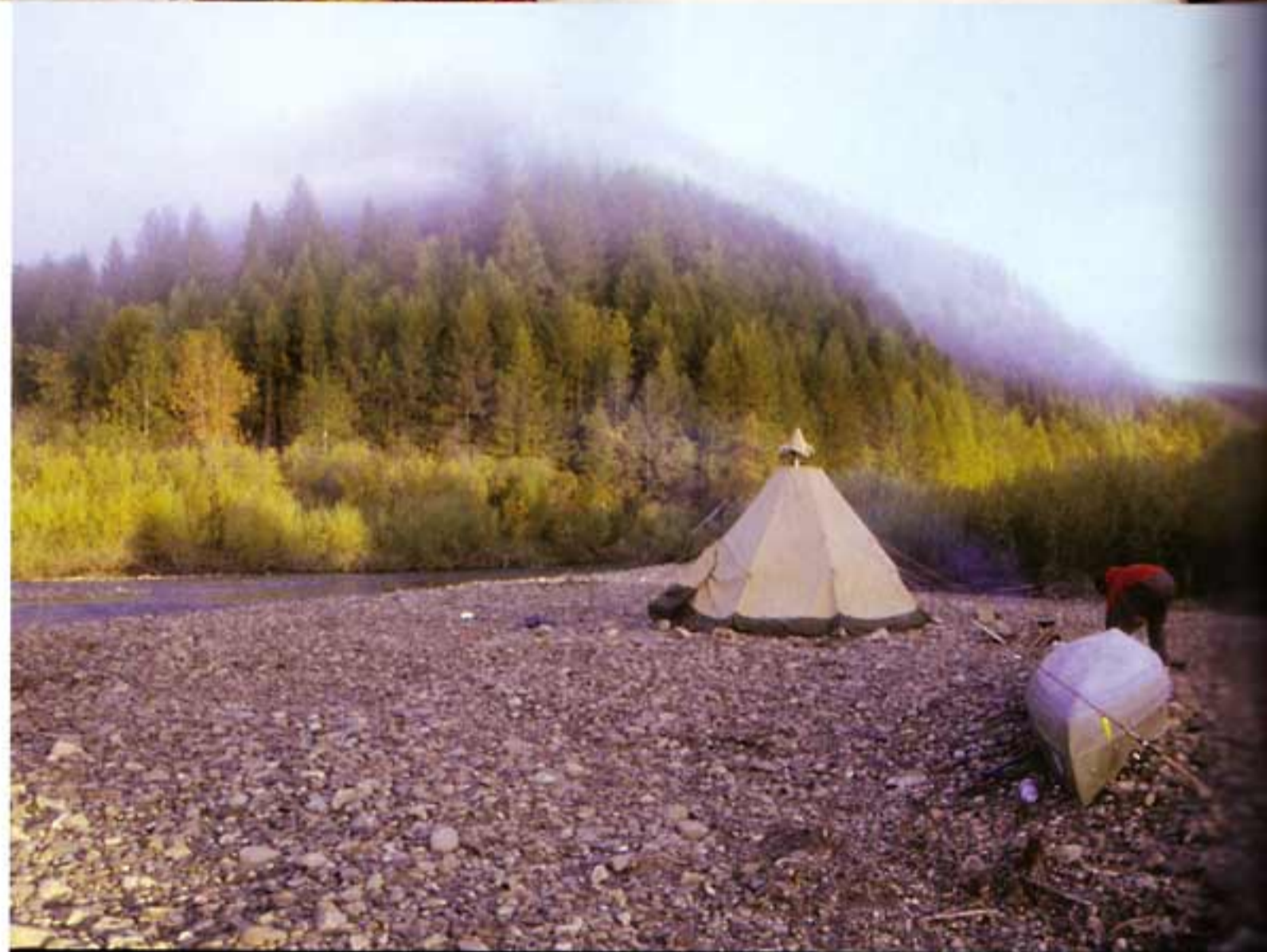
Indul a reggeli halászat

TAM. Már körülbelül egy hónapja evezhettünk, mikor megpillantottuk a parttól 20 méterre. A bundája ragyogott, ahogy a Nap sütötte, az orra már kicsit szürkült, biztos a kora miatt és érezhetően egy kicsit zavartan viselkedett a jelenlétünk miatt. Abban a pillanatban egy kicsit elbi-