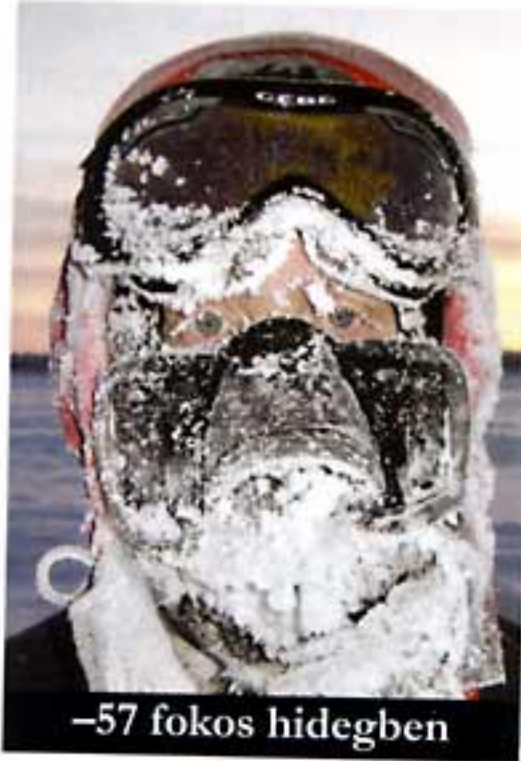
-57 fokos hidegben

MÉG CSAK HÁROM NAPJA INDULTUNK , a természet azonban máris próbára tett minket. Éreztük, hogy innentől kezdve minden nap az életben maradás számunkra a tét. A kissé túlterhelt kenunkat a partra szeretettük volna vonszolni és szívesen tartottunk volna egy kis szünetet, hogy kitisztaljon a fejünk. Ebben a pillanatban mindkét oldalról előtött minket az ár. A folyamatos esőzésnek köszönhetően a folyó vízszintje nyolc métert emelkedett két napon belül. Ősz