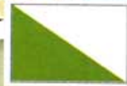
a nemzeti zászló