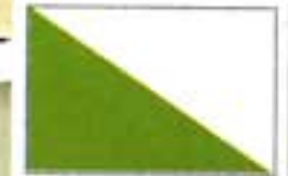
a nemzeti zászló