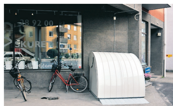
Vad är det här nu då? Ett permobilgarage.