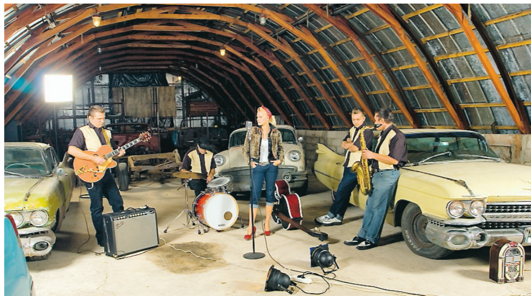
Den estniska rockabillygruppen Rockin' Lady & Her Rivertown Boys gör sin första Sverigespelning på Temakrogen i helgen.