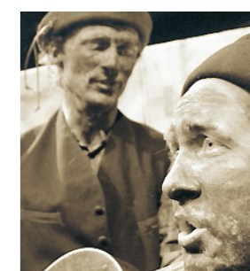
"Kolarhistorier" bygger på Dan Anderssons debutroman.

Biljetter: 0155-24 89 88 samt culturum.com